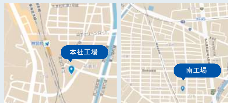
②本社工場 名古屋市熱田区 花表町20番12号