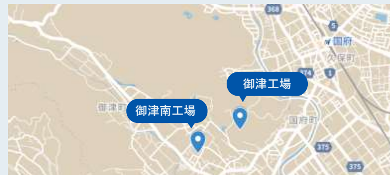
①御津工場 豊川市御津町広石高坂15番地