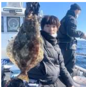
ルアー フィッシング